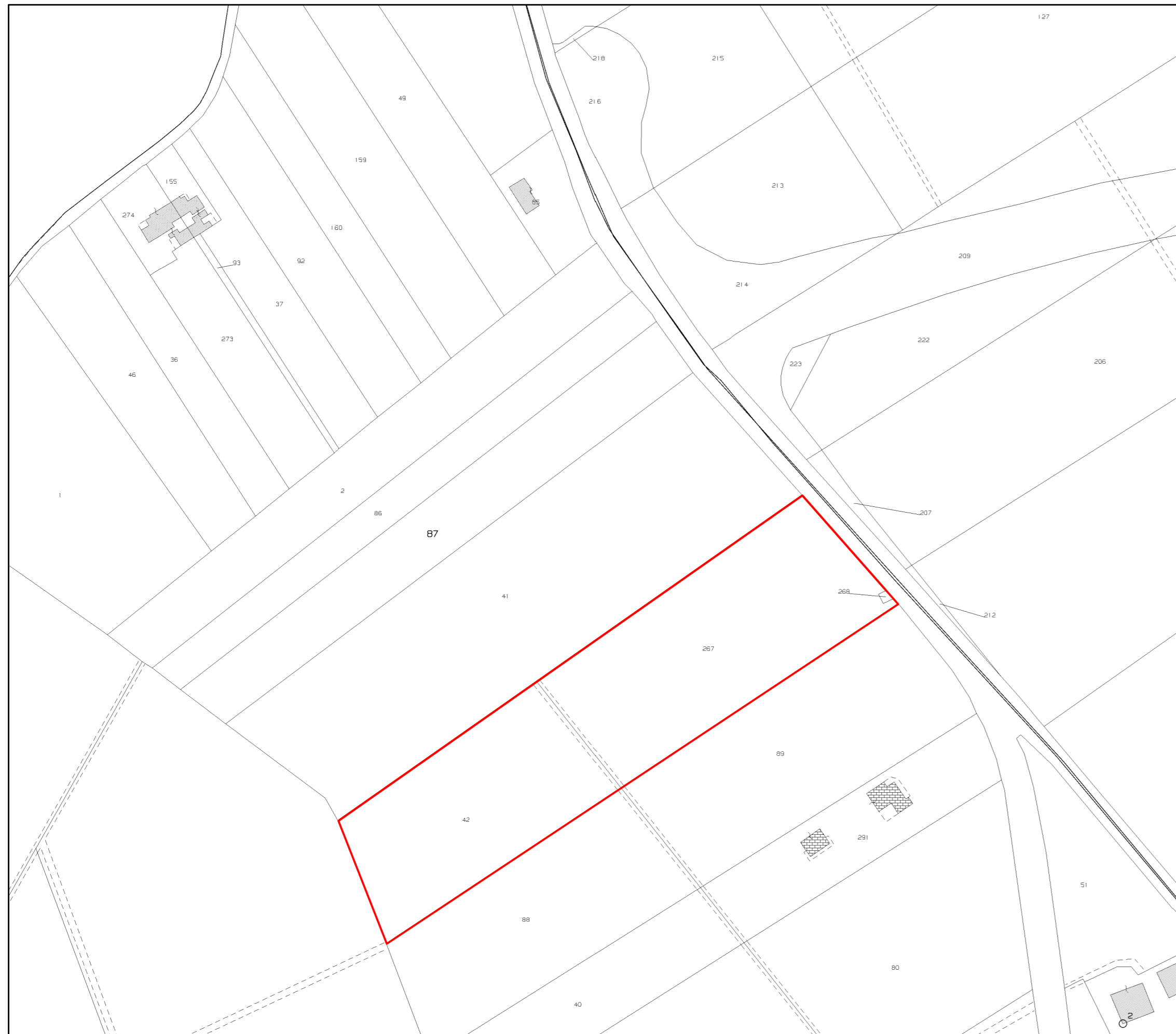
ESTRATTO DI MAPPA Scala 1:2000 COMUNE DI CARCERI

AMBITO D'INTERVENTO P.U.A. ZONA D2 PRODUTTIVA DI PROGETTO - 1° STRALCIO ESECUTIVO